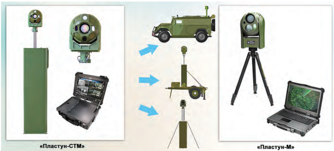
Рис. 13. Многоканальный мультиспектральный оптико-электронный комплекс наблюдения и разведки «Пластун-СТМ» и «Пластун-М»

Быстро разворачиваемые системы охраны (БРСО) относятся к аппаратным средствам охранной сигнализации и предназначены для контроля периметров временных полевых объектов, отдельных рубежей или зон. В зависимости от типа используемых сенсоров все БРСО делятся на классы, принадлежность к которым определяется физическим принципом работы и собственно используемым датчиком: СВЧ-лучевой, инфракрасный (ИК), емкостной, вибрационный, акустический и т.п.