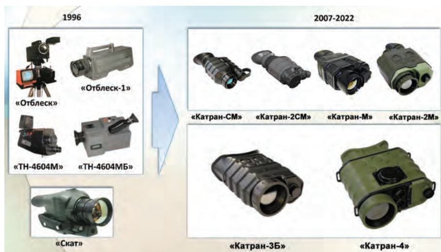
Рис. 8. Неохлаждаемые тепловизионные средства производства Спецотдела № 6 и НПЦ «Спектр-АТ»

стемы (ТС) относятся к классу «наблюдательные» или «поисковые» и условно, в соответствии с общепринятой классификацией, делятся на три основные группы: