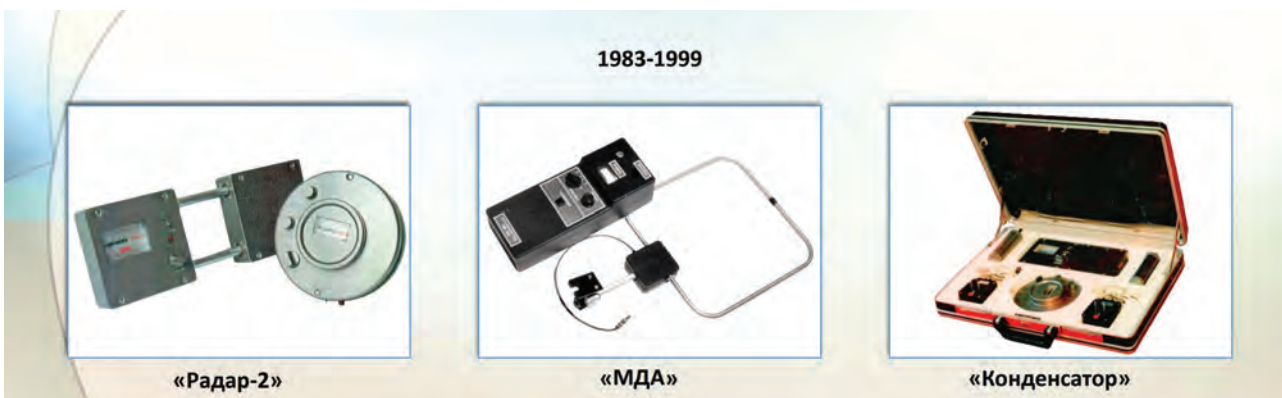
Рис. 2. Основные результаты работы радиоволнового сектора

Основным итогом работы этого направления, функционировавшего достаточно короткий период, было создание ряда комплектов радиоволновой аппаратуры серий «КОНДЕНСАТОР», «РАДАР» и МДА (рис. 2), предназначенной для обнаружения и определения местоположения токопроводящих и диэлектрических включений, а также конструктивных и искусственных пустот в строительных конструкциях из бетона, железобетона, кирпича и дерева. С помощью этой аппаратуры можно выявлять местоположение скрытой провод-