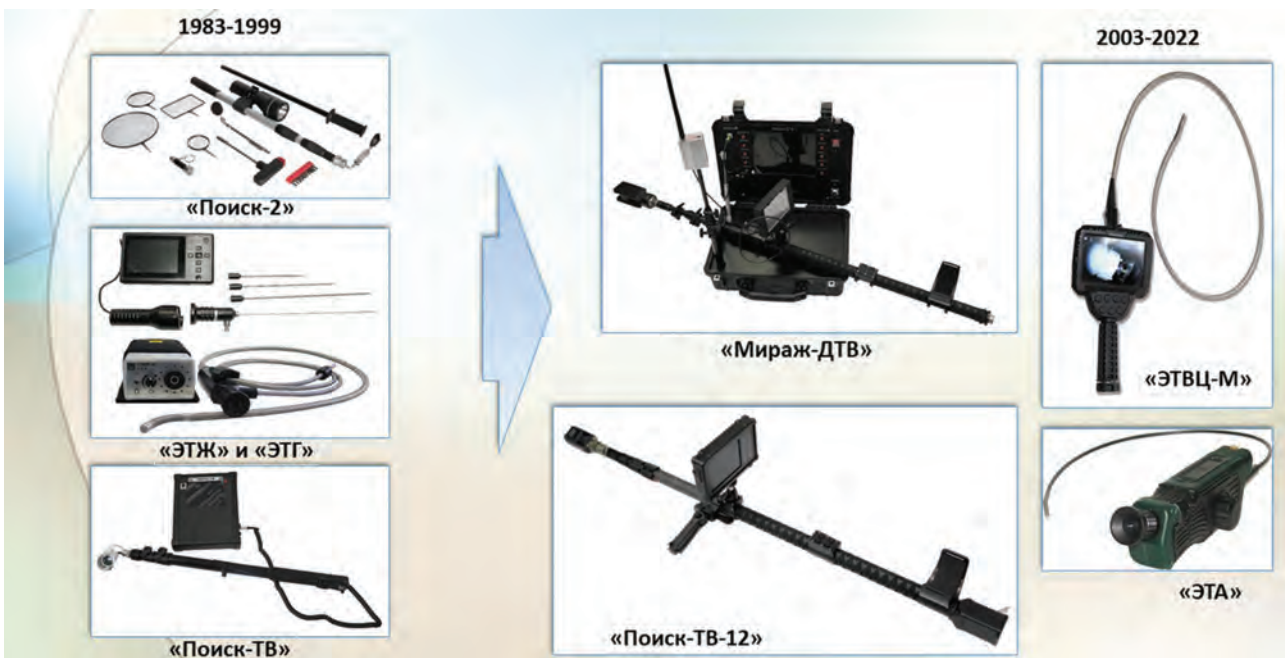
Рис. 5. Поисково-досмотровое оборудование

В 1978 г. коллективу Спецотдела была сформулирована задача, заключающаяся в необходимости создания переносных приборов и стационарных комплексов для поиска скрытых дефектов и посторонних вложений в плоских диэлектрических материалах, выявления подчисток и исправлений в документах и ценных бумагах. В рамках этого на-