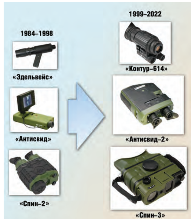
Рис. 7. Аппаратура наблюдения и контроля

На рис. 6 представлены некоторые образцы криминалистической техники разных периодов разработки, позволяющие оценить уровень прогресса в создании такой аппаратуры.